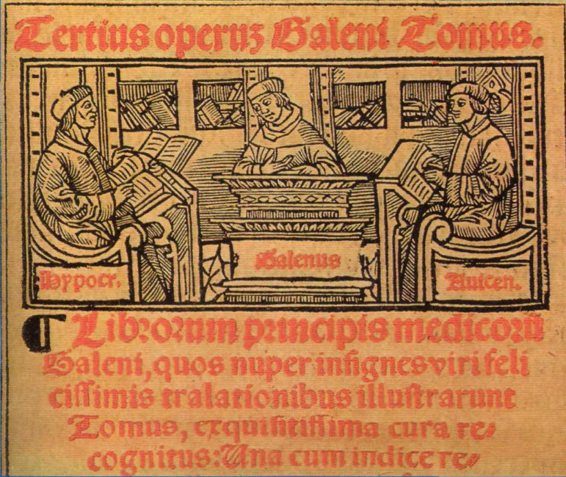
Hippokrates, Galenos ve İbn-i Sina. 1528'de Lyons'da yayımlanan bir resimli elyazmasından.