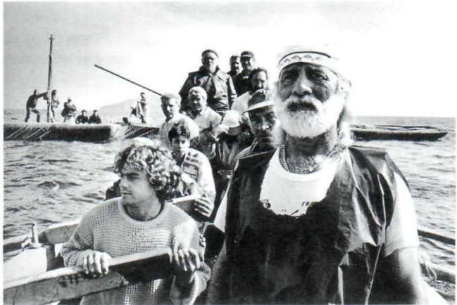
Trapani, Sicilya, İtalya, 1991.

dünyaya çok sağlam bakan bir gözün gördüğünden algılanan ve onu başkalarıyla paylaşan, sergiler ve kitaplarla bütün dünyaya yayılan bir gözün ürünüdür. Duyguların bir kaydedicisidir.