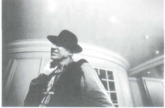
"Sebastião Salgado", Ara Güler, Paris.

Ve ben seçmek için kutulara bakmaya başladım. Bu oldukça zor bir işti. Onun dünyasını fotoğraf-