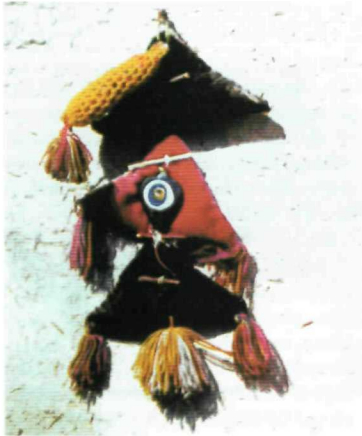
Çeşitli muska örnekleri

lemlerse -sözgelimi nesnelere dokunmak, kimi yerlere ayak basmak, kimi yiyecekleri yemek, kimi hayvanları öldürmek vb.- tabuydu. Büyüsel uygulamada bugün sanat dediğimiz görsel ve işitsel yoldan hayvan, insan ve doğa olgularının resim, fetiş, maske ve taklit dansları, totemlerin, tanrıların, insana ya da hayvana yakın tasvirleri yapıyordu. Büyü çok zengin bir alandır. Yaşamın her alanında karşımıza çıkar. Kimi nesnelere, olgularda, canlılarda yani hemen her şeyde büyüsel yorumlar, inançlar vardır. İnsan yaşamının önemli geçiş törenlerinde, doğum, aşk ve evlenme, ölüm gibi olgularda büyüsel yorumlarla karşılaşırız. Bunların arasına giren başkaları ise; çocuğun ilk dişinin çıkması, kızların ilk adet görmesi gibi olaylara ilişkindir. Bu arada mevsimler ve hava tahmini, haftanın günleri ve ayları, ağaçlar, bitkiler, şifalı otlarla ilgili olanlar da vardır. Örneğin; bazı ağaçlar incir, zeytin, nar, hünnap gibi kutsaldır. Buna karşın ceviz ağacını kesmek tehlikelidir... Bu arada lanet okuma, sövüp sayma, ilenç, hayır dua niteliğindeki sözlerin