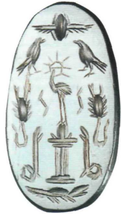
Antik döneme ait koruma amaçlı büyü